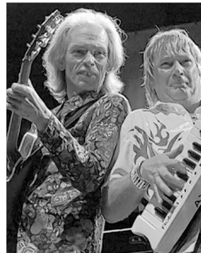
Bombast-Rock-Dinos: Steve Howe und Geoff Downes von „Asia“.