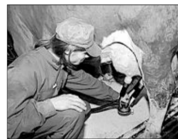
Alles im Griff.

Die Siegerehrung am Mittwoch um 18.30 Uhr soll der bayerische Landwirtschaftsminister Helmut Brunner zusammen mit Claudia