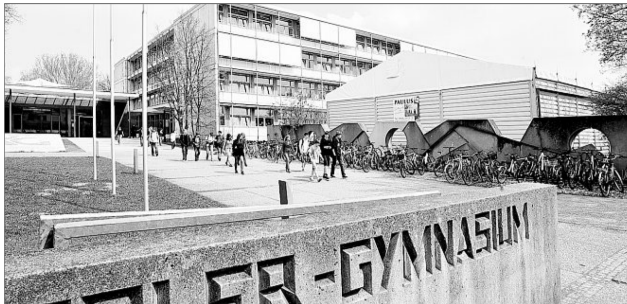
Direkt am Haupteingang zwängt sich das neue „Sportzelt“ zwischen Straße und Gebäude.